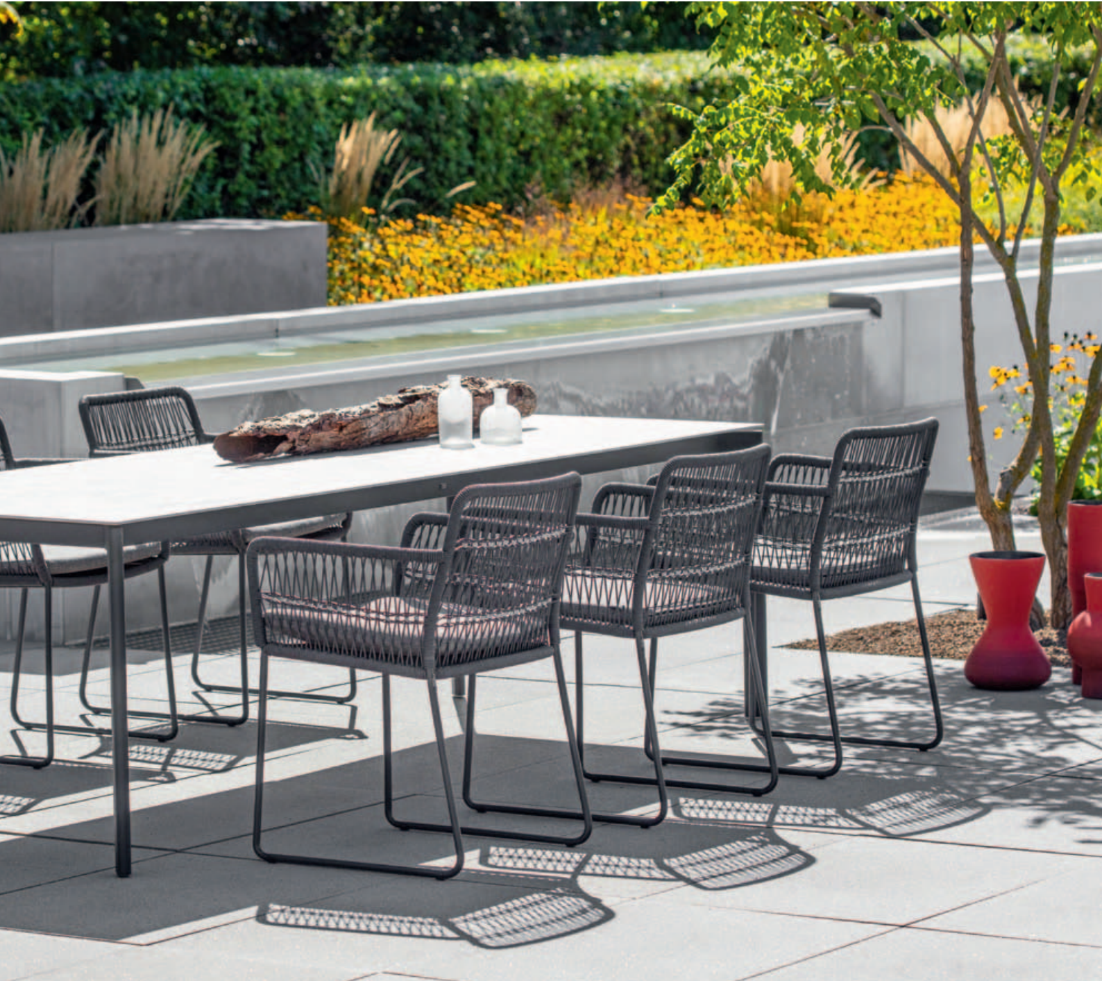
Collections Filo, Rio