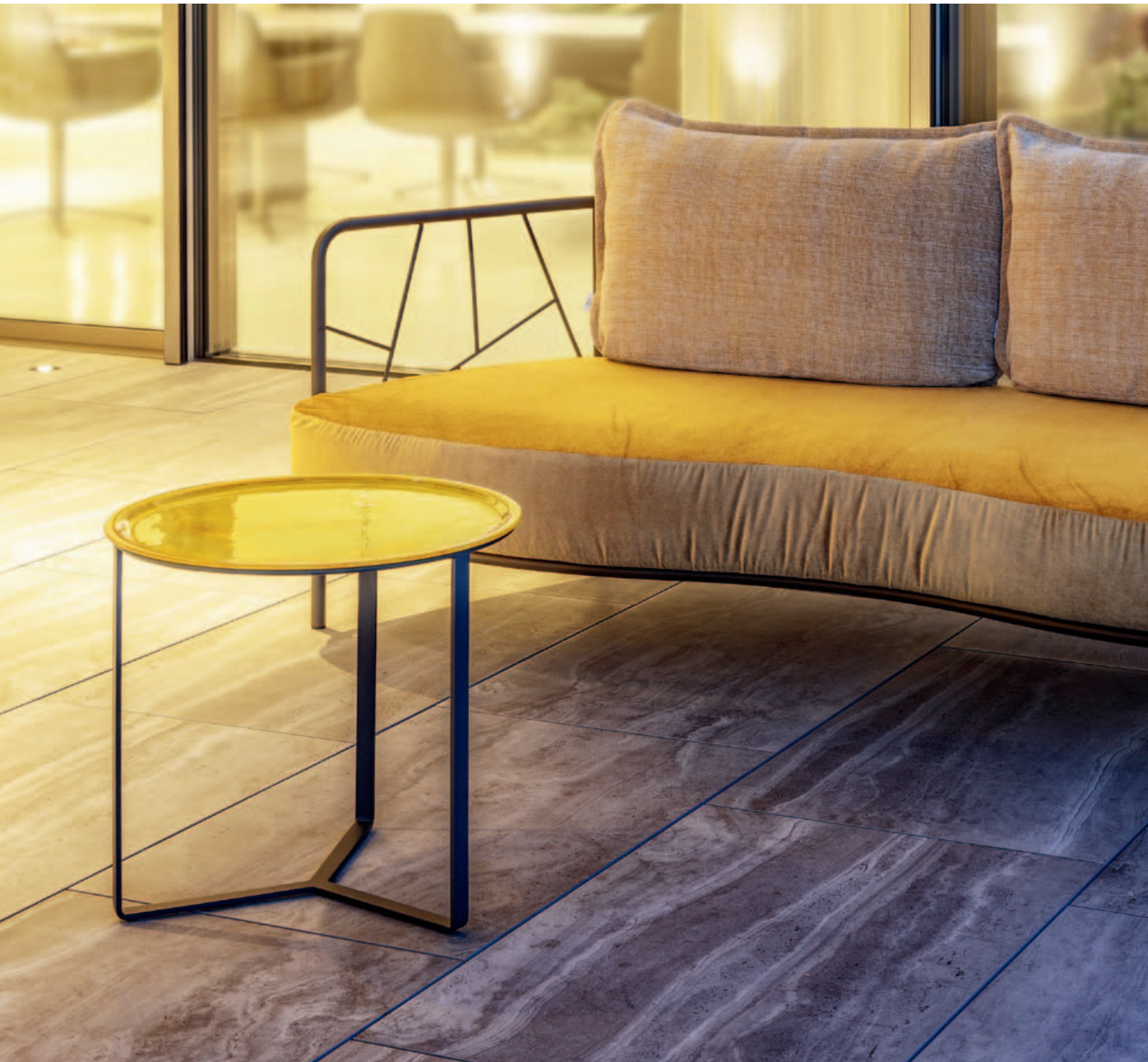
Collections Aura, Trios