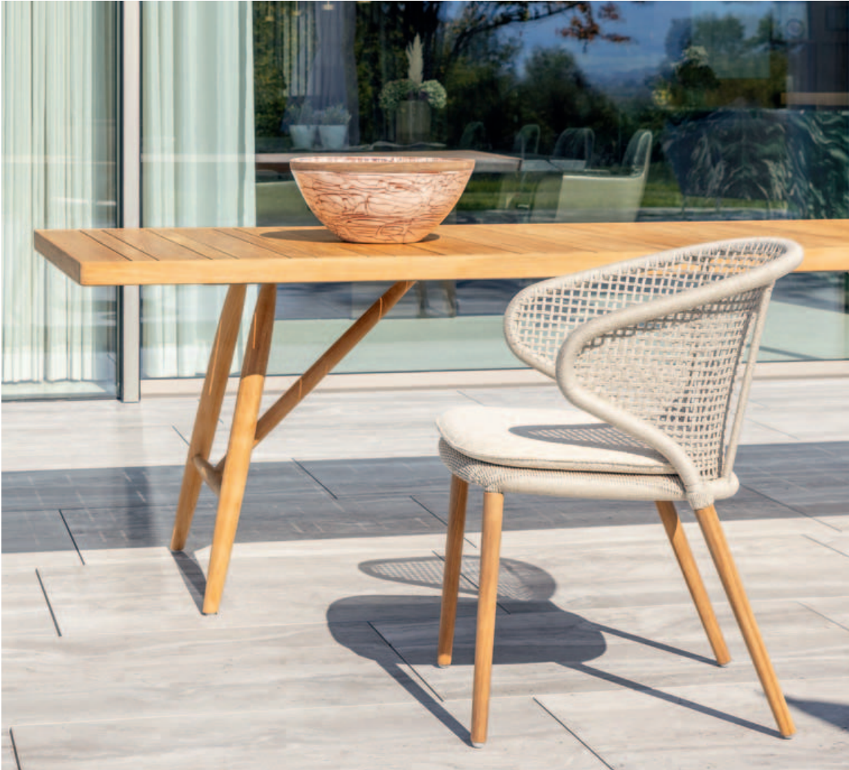
Collections Beluga, Faro