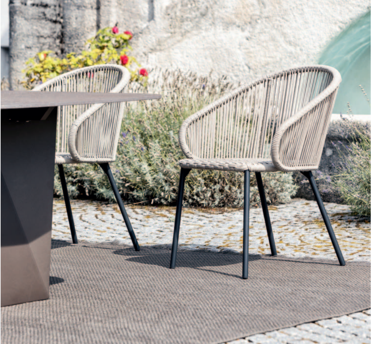
Collections Tierra, Basil