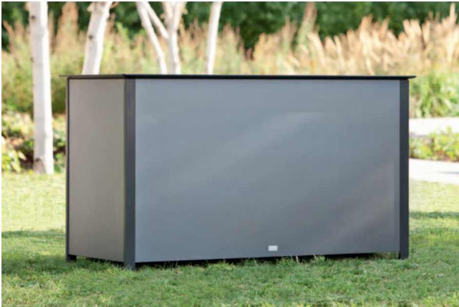
Collections Woodline, Cushion box, Aluline